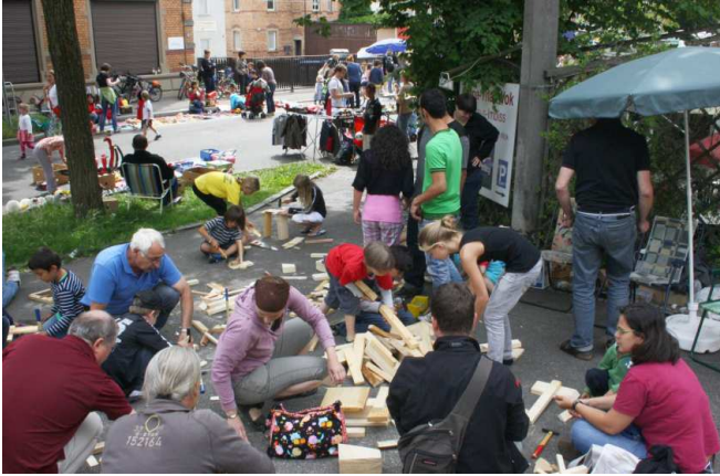
Immer viel los am Holzbauplatz - im Hintergrund der Kinder-Flohmarkt