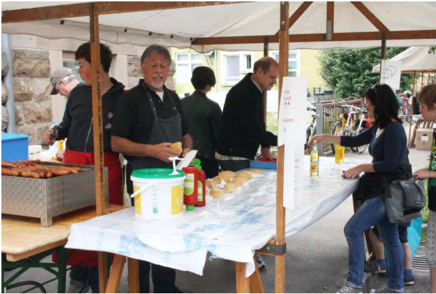
Lecker Rote - der BI-Würstchenstand