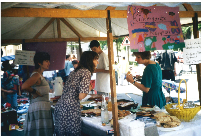
Kuchenverkauf am Stand vom "Rapp-Schule"