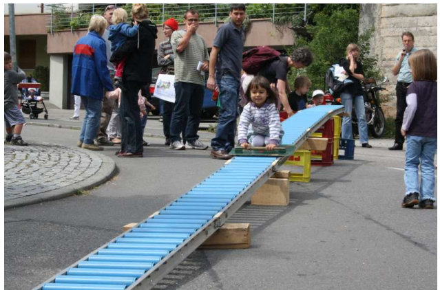
Die vielgeliebte Rollenrutsche