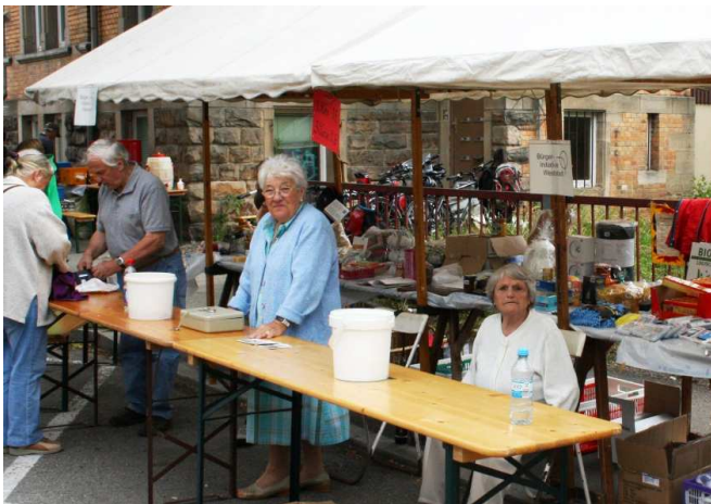
"Lose zu verkaufen..." kein Straßenfest ohne unsere Tombola