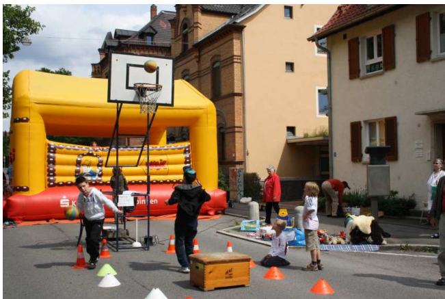
Hüpfburg und Basketball